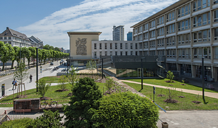
INSA-Gebäude und -Campus am Boulevard de Victoire 24 in Strasbourg