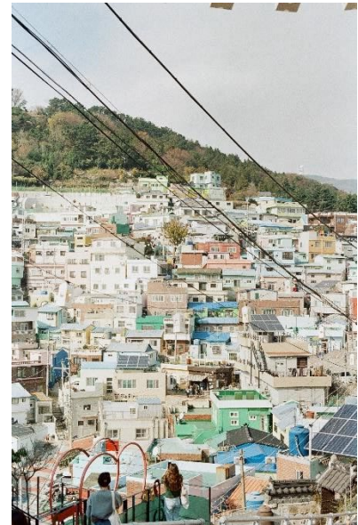
Busan: Gamcheon Culture Village