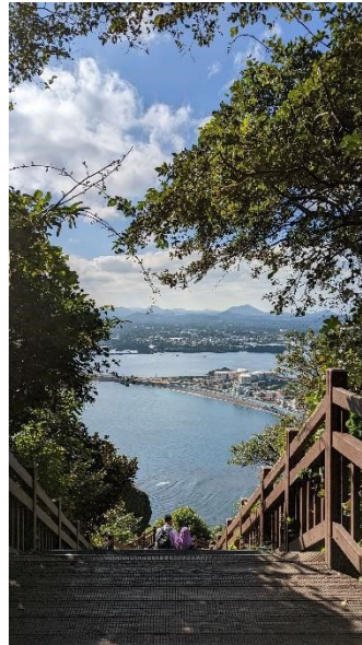
Jeju: Sicht vom Seongsan Ilchulbong