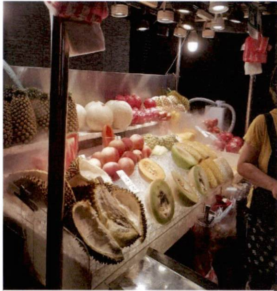
Obststand auf dem Raohe Night Market, Taipei

kann und einem unangenehme Überraschungen erspart bleiben. Einigen anderen Austauschstudenten, die ihr Zimmer über MyRoomAbroad bereits vorab gebucht hatten, haben schlechte Erfahrungen gemacht. Bei manchen war aber auch alles in Ordnung. Der Nachteil an der Vorortsuche ist, dass natürlich viele Zimmer schon weg sind und man in den ersten Tagen schon sehr eingespannt ist mit der Wohnungssuche. Ich würde es trotzdem wieder so machen. Die Dorms auf dem Campus sind nur für Studenten, die ihr gesamtes Studium an der NTUST absolvieren. Von der Lage her ist, ist das Gebiet zwischen Guting und Gongguan (grüne Linie der MRT) zu empfehlen, da man einen kurzen Weg zur Uni hat. Preislich liegt Taipei leider mindestens bei den deutschen Mieten. Ganz grob sollte man mit 10.000 – 15.000 TDW pro Monat rechnen.