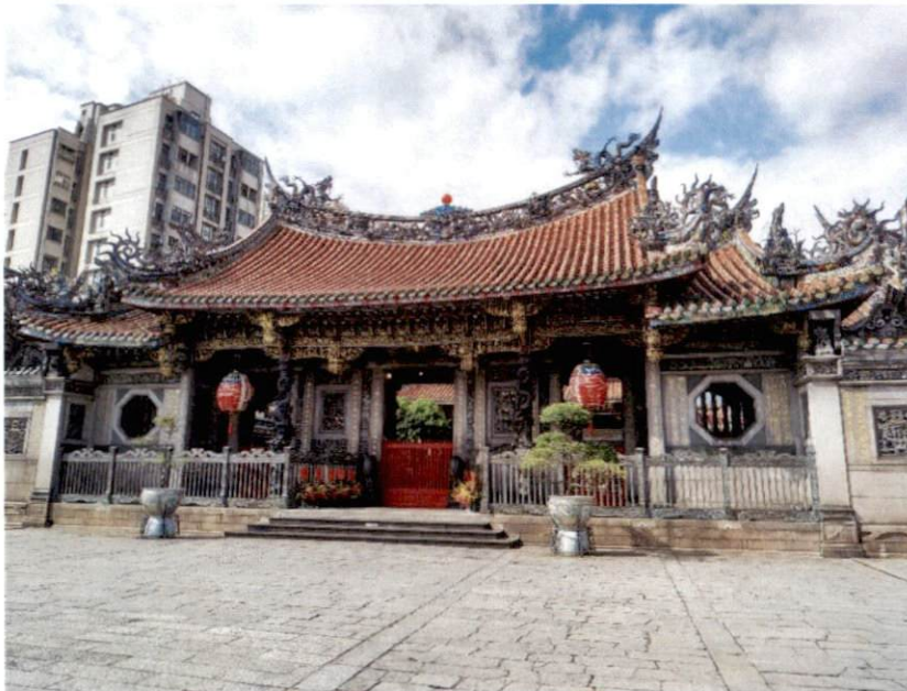
Longshan Tempel, Taipei

Taiwanesen sind solche herzlichen Menschen! Man fühlt sich sofort wohl und wird immer offen aufgenommen. Zu Beginn sind sie manchmal etwas zurückhaltend und eher scheu, das legt sich aber nach kurzer Zeit. Ich wurde sogar von meinem Buddy zur Familie nach Hause zum