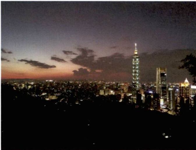
Taipei101 bei Nacht

Die Hochschule Karlsruhe hat zahlreiche Partnerschaften zu Universitäten und Hochschulen weltweit. Deshalb war es einfach für mich, eine passende Hochschule in Asien zu finden. Die Wahl ist schließlich auf die National Taiwan University of Science and Technology (NTUST) gefallen, da sie einen sehr guten Ruf genießt aber trotzdem nicht zu groß ist. Zudem bietet sie eine große Anzahl an Masterkursen in den Fachbereichen Information Management und MBA an.